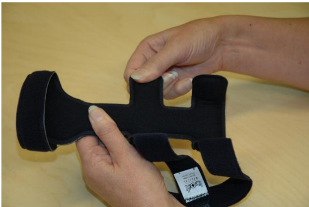
Bort lastan valmistelu: Ota kiinni radiaalipuolen keskituesta ja käännä se taakse

Lastahoitoa toteutetaan vähintään 2kk:n ajan.