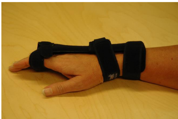
Lasta puettuna: Lasta kiinnitetään kauimpana olevien sorminivelten tai keskimmäisten sormiluiden kohtaan