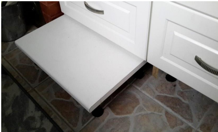
Kuva 1. Astinlauta

Astinlauta helpottamaan työtasolla työskentelyä. Sisään työnnettävä / ulos vedettävä astinlauta on asennettu kaapiston alle sokkelin paikalle (kuva 1.). Astinlaudan saa näppärästi piiloon kun sitä ei tarvitse.