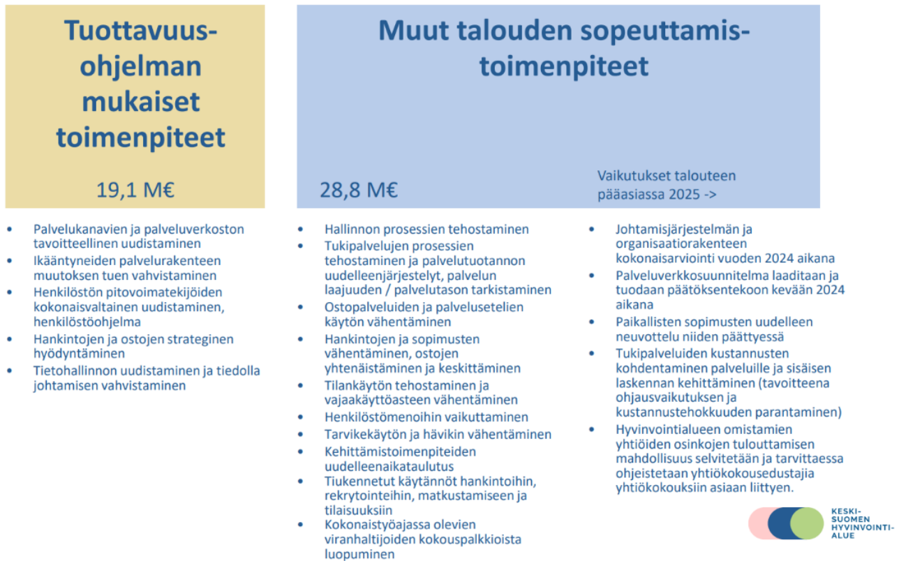
Kuvio 3. Keski-Suomen hyvinvointialueen sopeuttamistoimenpiteet vuodelle 2024.

Esimerkkinä mainittakoon, että palveluverkkoesityksen mukaisten toimien arvioidaan vähentävän kustannuksia 12,3 miljoonaa euroa vuosittain viimeistään vuoteen 2030 mennessä. Puolivuotiskatsauksessa linjataan, että operatiivisessa lähijohtamisessa kiinnitetään huomiota erityisesti taloudellistoiminnallisiin toimenpiteisiin.