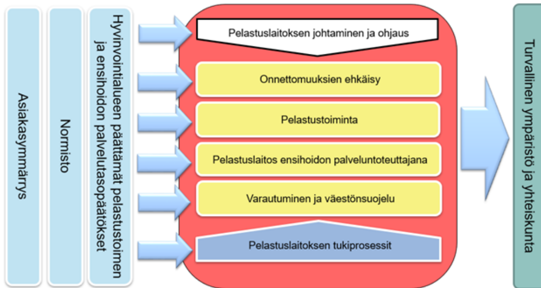
Kuva 1. Pelastuslaitoksen prosessikartta esittää kokonaiskuvan ja kuvaa organisaation ydinprosessit