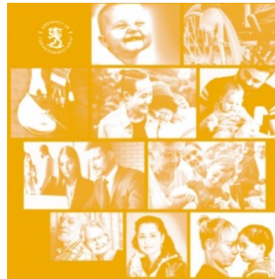
Suomen kestävän kasvun ohjelma

Monialaisen palvelukonseptin ja siihen liittyvän digitaalisen palvelutarjottimen linjauksiin voi tutustua Suomen kestävän kasvun ohjelman hankeoppaassa (erityisesti Pileri 4, investointi 2).